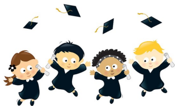
Wiktoria Duda VIa

Życzę Wam udanych wakacji pełnych przygód i uśmiechu. Wracajcie do szkoły wypoczęci i pełni wrażeń.