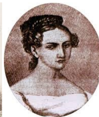
Adam Mickiewicz i Maryla Wereszczakówna