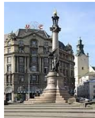
Pomniki Mickiewicza w Krakowie i we Lwowie