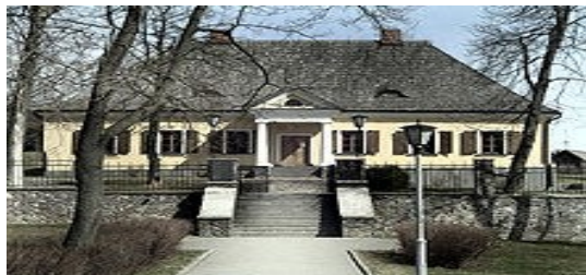
muzeum w Nowogródku